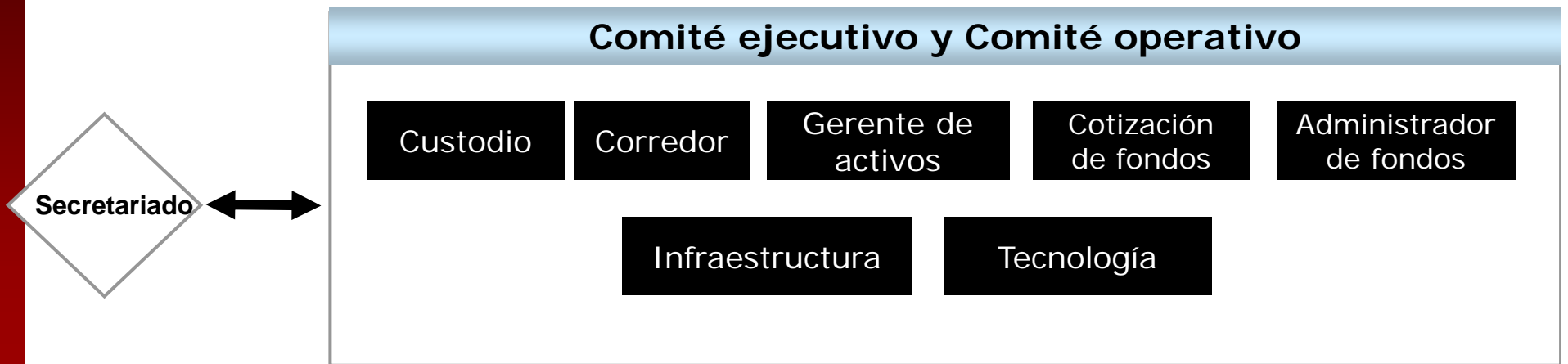
Membresía según domicilio