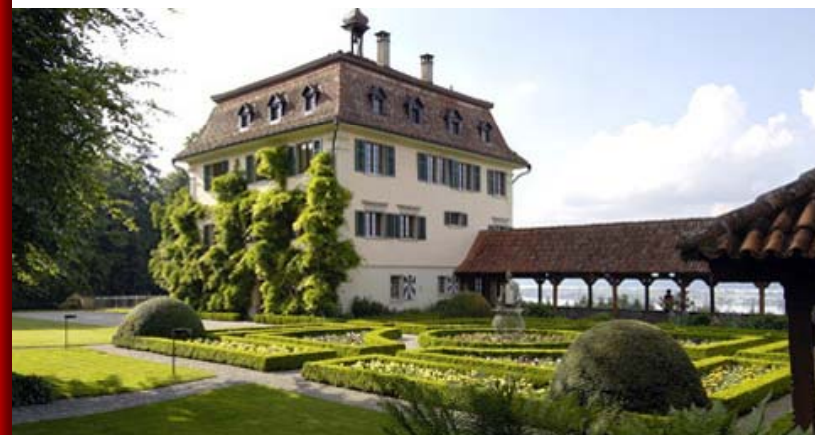
Centro de conferencias de UBS Wolfsberg, Suiza